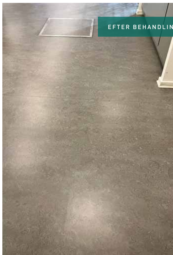
Gangarealer på fjernvarmeværk på Fyn udført af Jakobsens Gulvservice - renoveret med PUR Floor Sealer, klar.